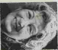
Imgard Keun Schriftstellerin