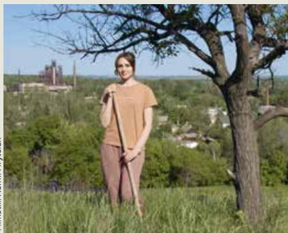
Filmstill: Kornii Hrytsiuk